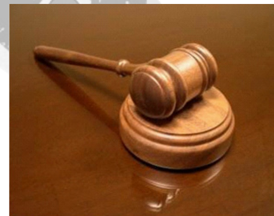
Diritto alla giustizia