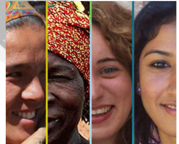
I diritti delle donne