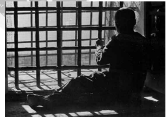
I diritti dei carcerati