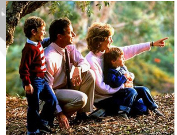
Diritto alla famiglia