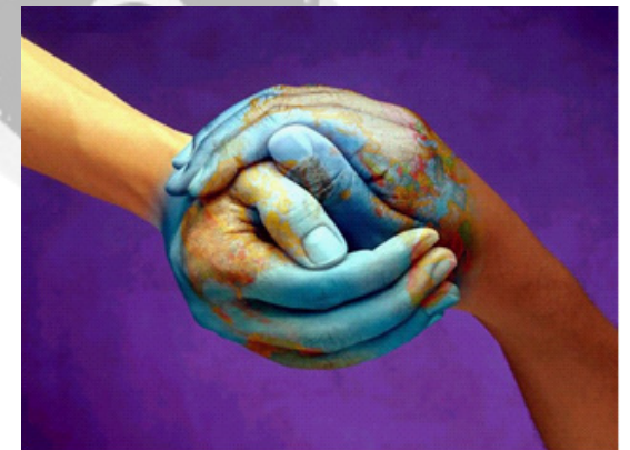
Diritto alla solidarietà